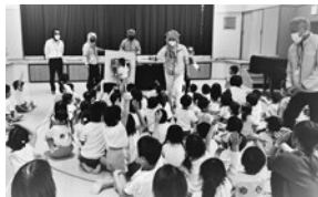
「手洗い教室」双葉幼稚園