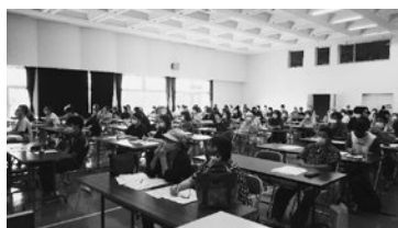
食品衛生責任者講習会