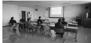
R3.11.17 食品衛生指導員養成講習会(地区)

11月8日(月)から24日(水)まで、旧島原支部管内の第2回業者検便受付を実施。旧小浜支部管内は1月31日実施予定。