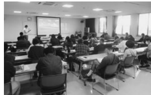
R3.10.26 食品衛生責任者養成講習会

11月8日(月)から24日(水)まで、旧島原支部管内の第2回業者検便受付を実施。旧小浜支部管内は1月31日実施予定。