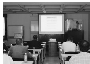
食品衛生指導員研修会の様子

10月14日長崎県建設総合会館において開催。HACCPの考え方を取り入れた衛生管理の講義・新しい指導票の記載方法の説明が行われた。