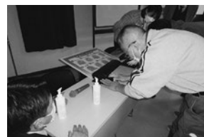
新規食品衛生指導員養成講習会の様子

11月17日長崎県建設総合会館において開催。講義の後ATPふき取り検査・手洗いチェッカーを用いた実務研修を修了し、9名の方が食品衛生指導員の委嘱を受けた。