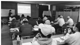
「指導員研修会」 HACCP記録指導方法の学習