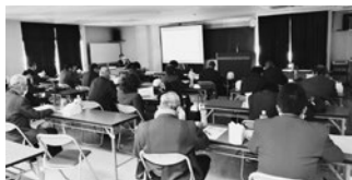
指導員研修会の様子

11月18日 交通会館に於いて、食品衛生責任者実務講習会テキストを基に研修会が行われた。